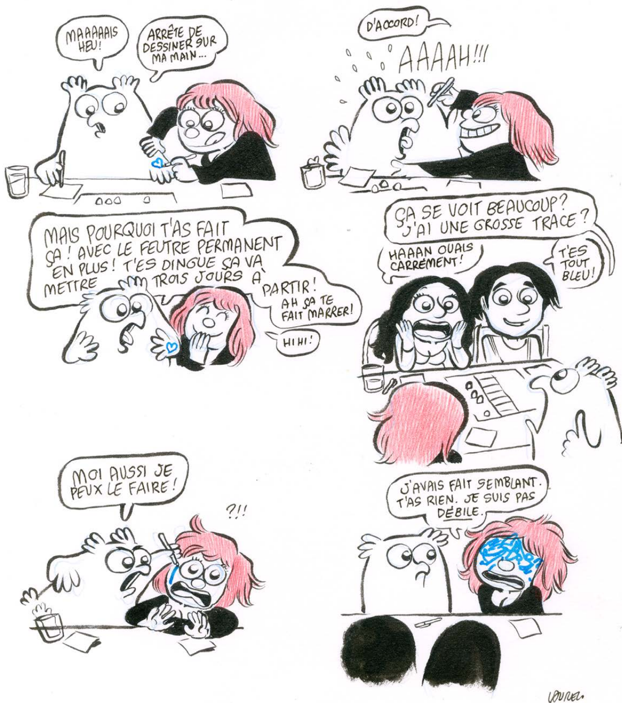
Indélébile Encre de Chine, crayons de couleur et feutre sur papier, 28x21 cm