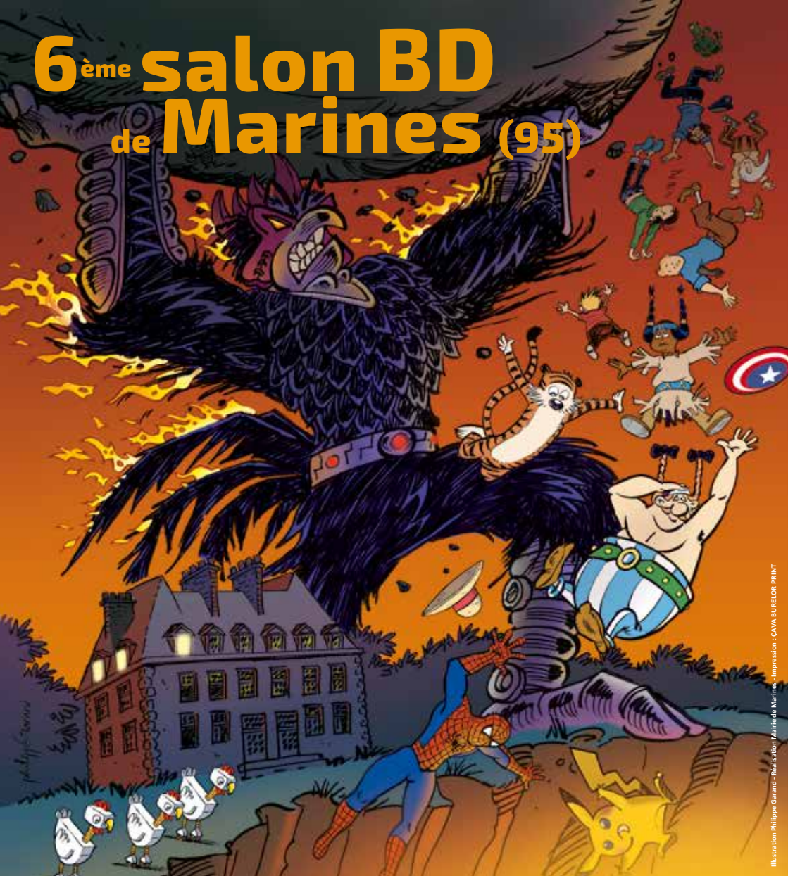
Illustration Philippe Grand - Réalisation Marie de Marines - Impression : CAVA BURELOR PRINT

SAMEDI 2 DÉCEMBRE 2017 - de 14h à 18h DIMANCHE 3 DÉCEMBRE 2017 - de 10h à 17h Salle Georges Pompidou - Rens. 01 30 39 70 21